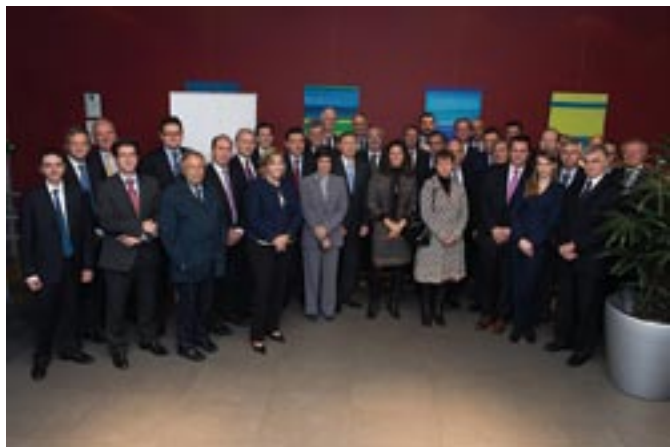
Valná hromada ELTI - Brusel listopad 2013

investic v Evropě, jakožto klíčového nástroje pro oživení evropské ekonomiky.